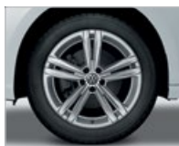
Jante en alliage 18" Sebring