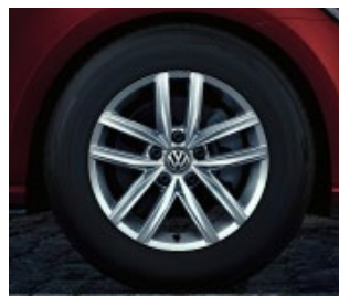
Jante en alliage 16" Hita