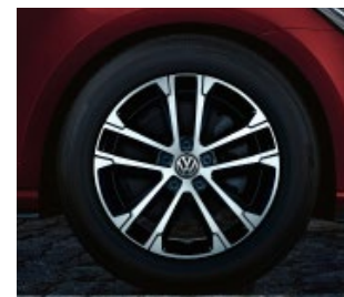
Jante en alliage 17" Singapore