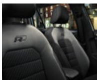
Sellerie spécifique R-Line