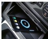
Chargeur sans fil